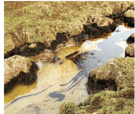
Brillo aceitoso en el agua

SONIDO – El volumen puede variar desde un siseo suave hasta un rugido fuerte, según sea el tamaño de la fuga.